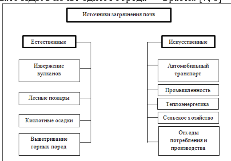
Рис. 1. Источники загрязнения почв *

В целом по средним показателям почвы Иркутской области испытывают нагрузку свинцом, цинком, кобальтом и сульфатами. По максимальным показателям почти все города загрязнены никелем, кадмием, медью, кобальтом, и абсолютно все почвы проанализированных городов содержат превышения ПДК по свинцу, цинку и сульфатам. Фтор только по максимальному значению незначительно превышает ПДК в почве одного города — Братск. [7, 8]